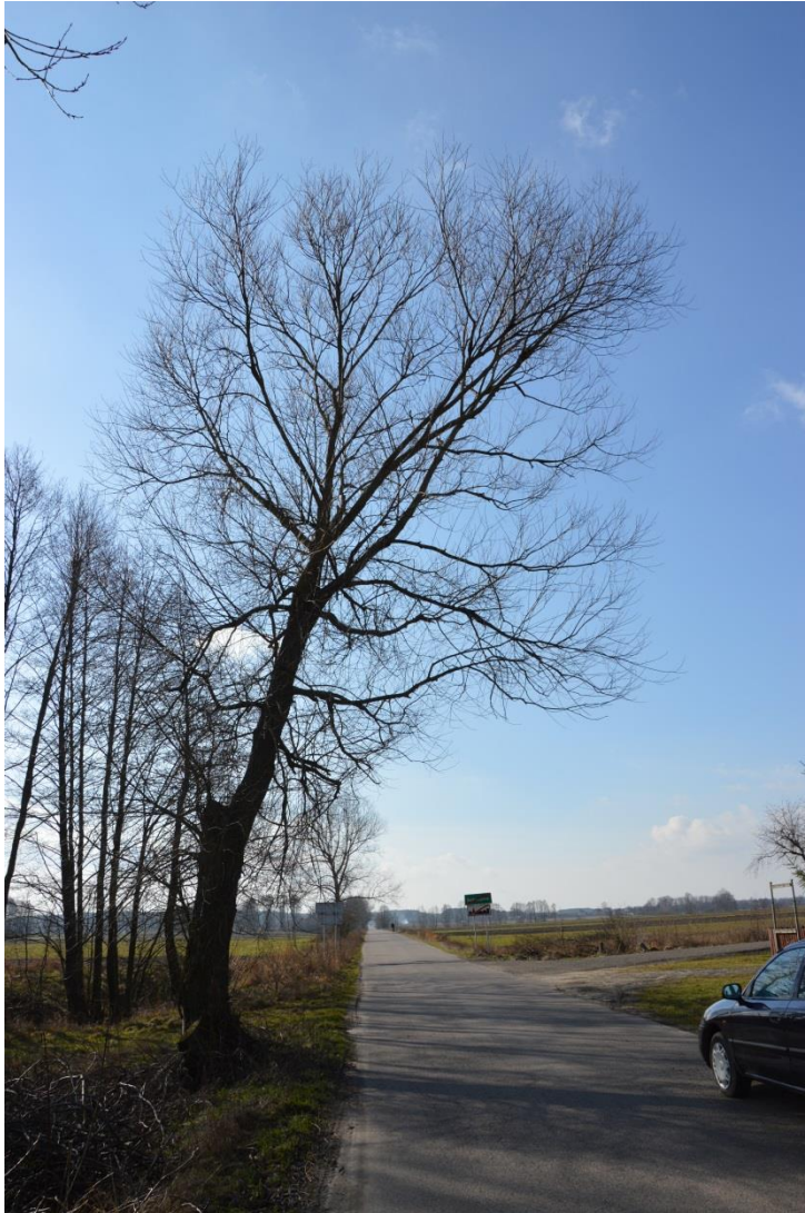
Drzewo nr 1