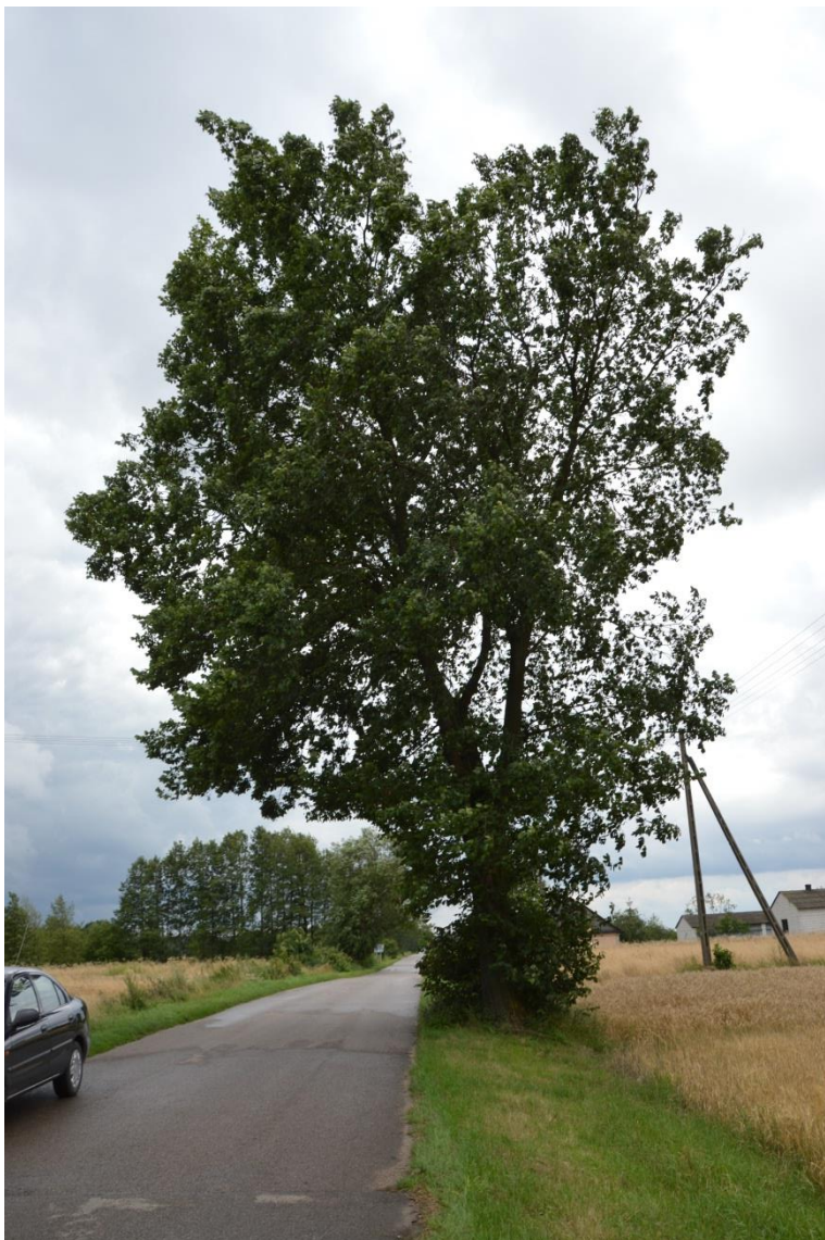
Drzewo nr 8